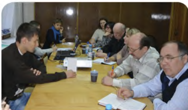
Обучение уполномоченных по охране труда

Информация Пермской краевой организации Профсоюза