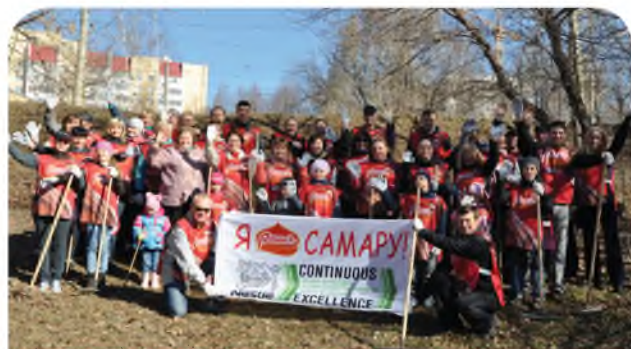
Ежегодная экологическая акция «Нам здесь жить»

Все работницы, находящиеся в отпуске по беременности и родам, пользуются льготами, которые предусмотрены социальной программой коллективного договора. Только в 2015 г. 52 женщины получили материальную помощь по рождению ребенка. Выплачено 43 пособия при уходе на пенсию. Кроме того, выделены две ссуды на улучшение жилищных условий. За последние четыре года ссуды на жилье получили 47