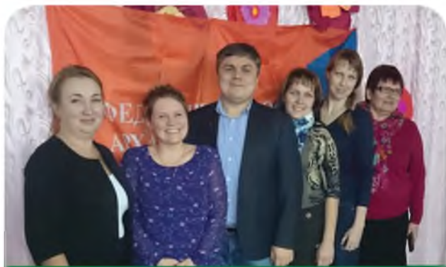
Участники обучающего семинара